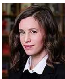
Kaouther Adimi Écrivaine, dramaturge et scénariste